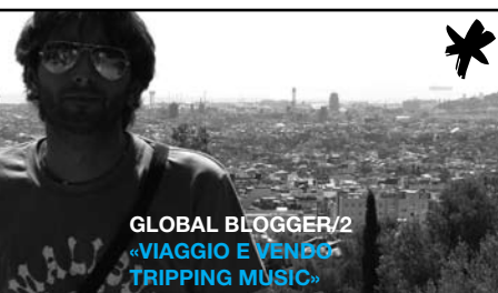
GLOBAL BLOGGER/2 «VIAGGIO E VENDE TRIPPING MUSIC»

Lo scambio casa è sempre più diffuso e conveniente. Per gli Usa, www.homeforswap.com ; per l'Australia, www.aussiehouseswap.com.au