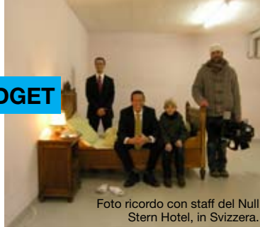
Foto ricordo con staff del Null Stern Hotel, in Svizzera.