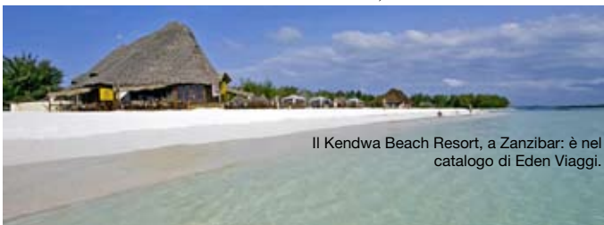
Il Kendwa Beach Resort, a Zanzibar: è nel catalogo di Eden Viaggi.

«Ascoltando quello che incontro. Ogni posto ti riserva bellissime sorprese: io le cerco per strada e nei negozi dove compro vinili e cd. In questo modo mi sembra di guadagnare ogni volta una nuova cittadinanza».