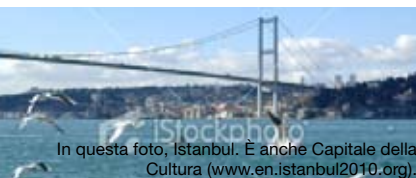
In questa foto, Istanbul. È anche Capitale della Cultura ( www.en.istanbul2010.org ).

Istanbul, in Turchia, con www.blu-express.com : ora i voli sono giornalieri. Scopri la città nella sua parte asiatica: zone ed eventi sono su www.timeout.com/istanbul