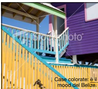
Case colorate: è il mood del Belize.

Tu ti registri online, il sito ti mette in contatto con altri viaggiatori per dividere i costi.